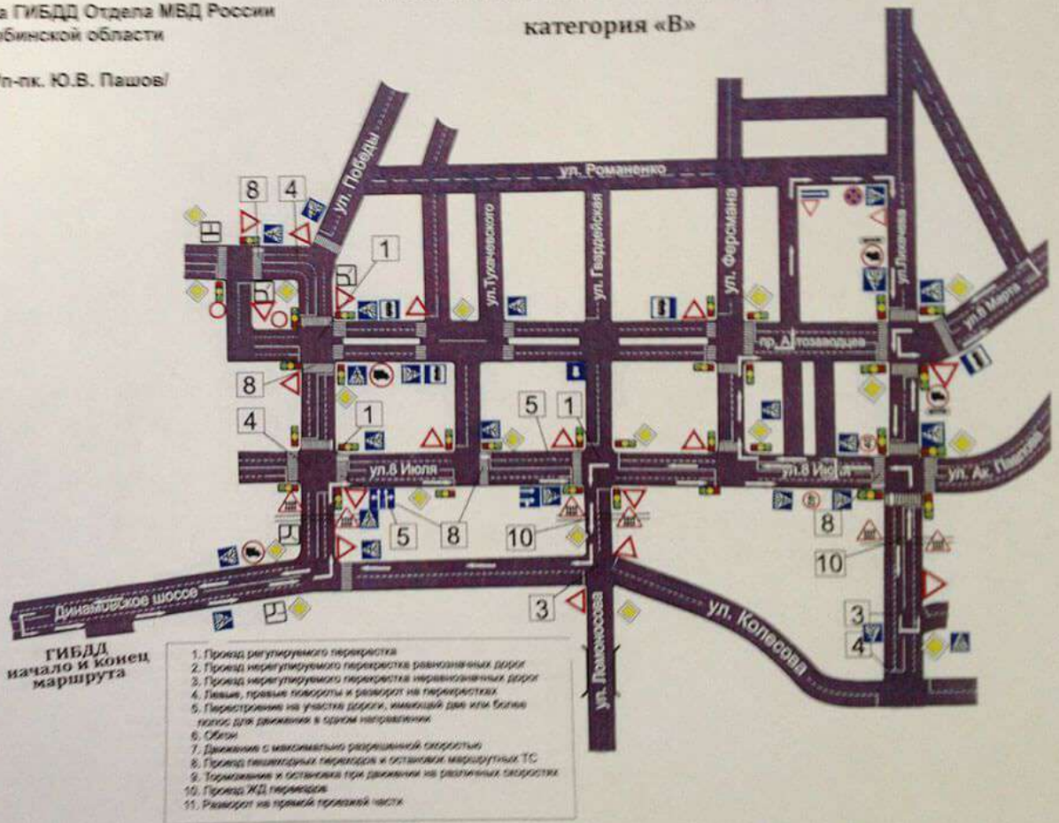
Схема экзаменационного маршрута №4 категория «В»